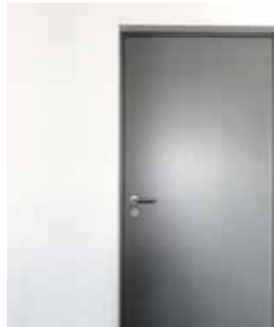
AquaLOCK® ist hochwasserbeständig* – für Tore und Türen